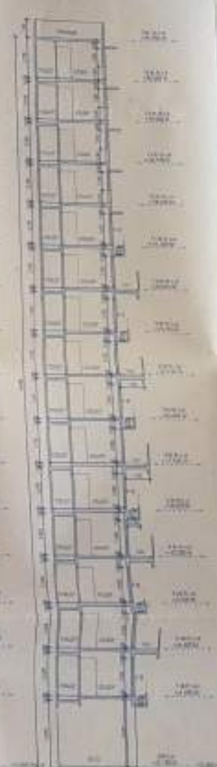
SECTION - B-B