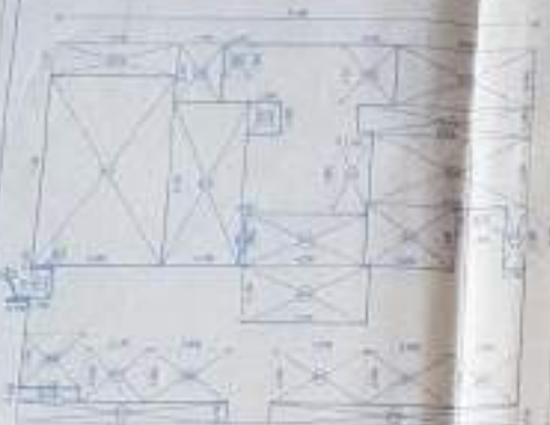
TYPICAL FLOOR AREA DIAGRAM (14th floor)