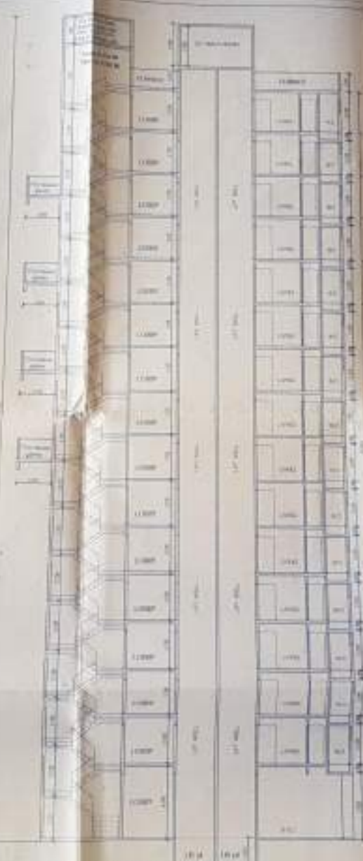
SECTION - A-A